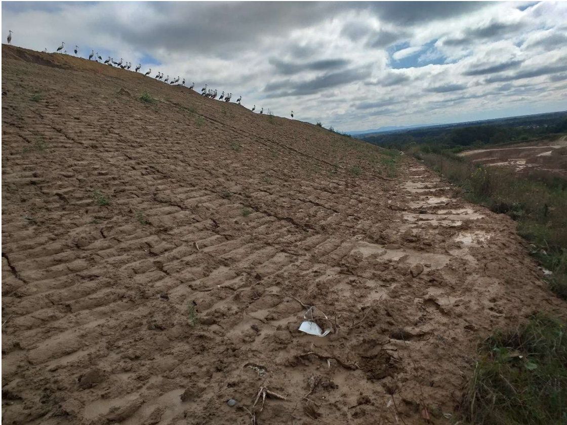
Digues de réhausse W5&6

Les casiers W5 et W6 ont atteint leurs cote maximale (189 NGF couverture sommitale comprise) à la fin de l'année 2024.