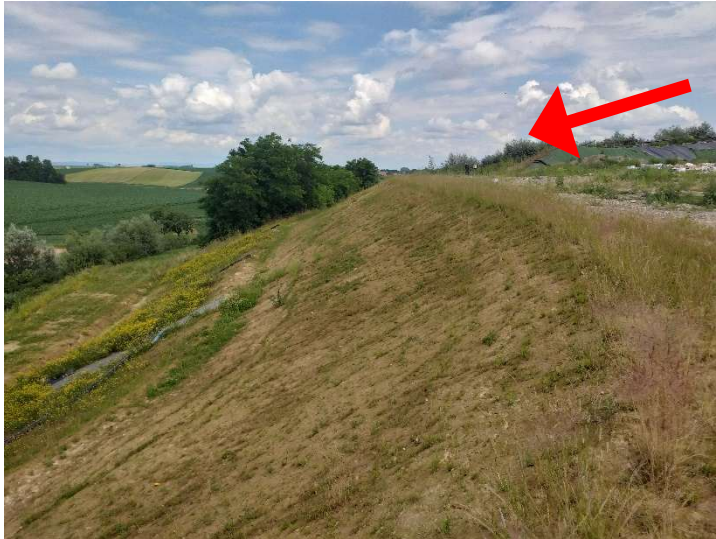
Digue périphérique de W6.