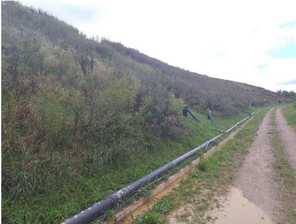
Vue couverture finale W2