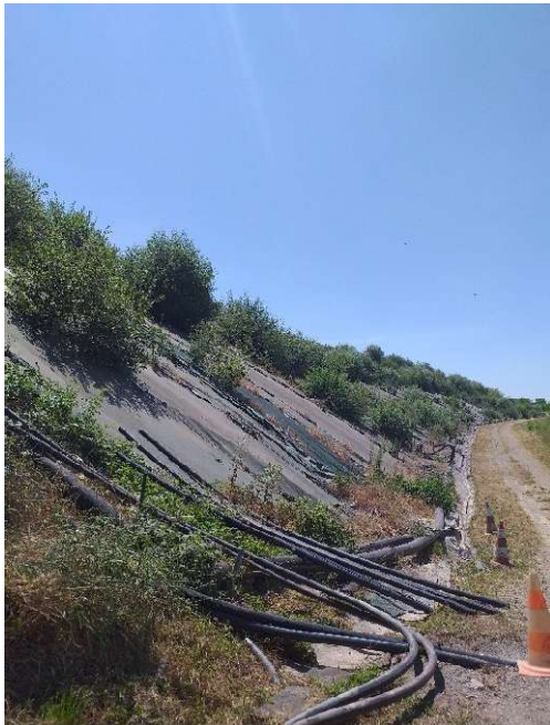
Wintzenbach 2 – couverture provisoire