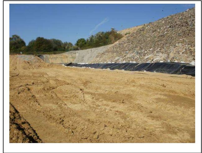
Début de terrassement pour créer W4