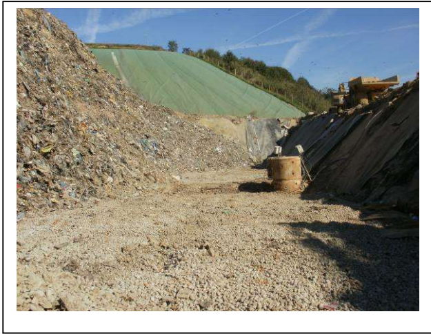
Evacuation des déchets le long de la plate-forme enrobée