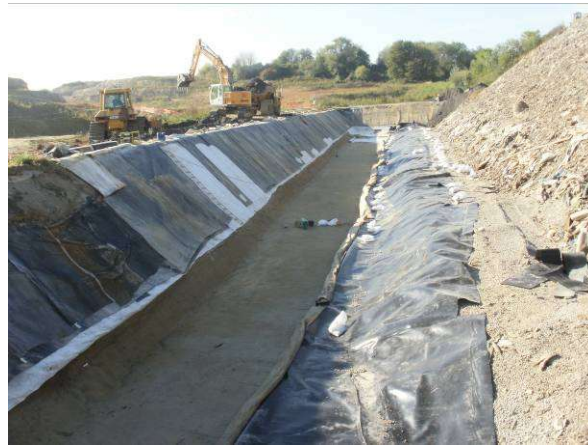
Extraction des déchets pour mise en conformité du flanc entre W3 et W4

En 2011, les travaux de mise aux normes du casier W3 ont continué par le déplacement des déchets sur le casier W4 et la mise aux normes des flancs Sud et Ouest du casier. Ces parties sont désormais conformes à l'arrêté de mise en demeure.