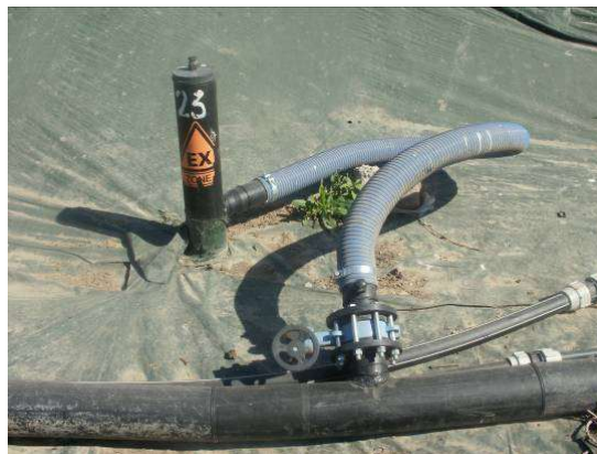
Puits de captage du Biogaz sur W2

Le site est équipé sur chaque casiers de plusieurs puits de pompage de biogaz qui sont soit spécifiques au biogaz, soit mixte en étant couplé avec le pompage du lixiviat.