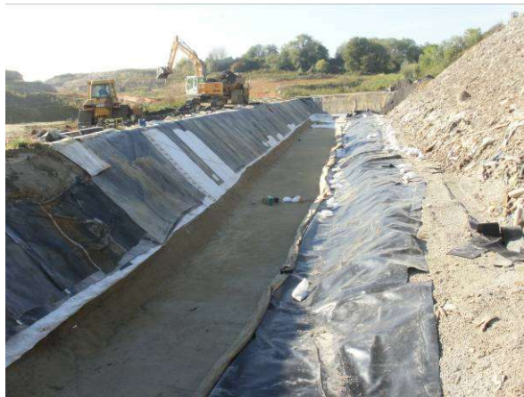
Extraction des déchets pour mise en conformité du flanc entre W3 et W4

En 2011, les travaux de mise aux normes du casier W3 ont continué par le déplacement des déchets sur le casier W4 et la mise aux normes des flancs Sud et Ouest du casier. Ces parties sont désormais conformes à l'arrêté de mise en demeure.