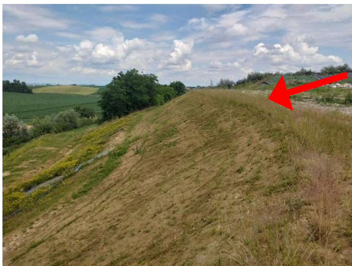
Digue périphérique de W6.

Les digues internes sont montées à l'avancement. Les digues externes sont également incluses à l'exclusion de l'étanchéité.