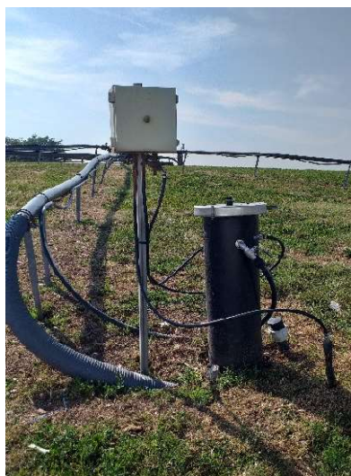
Puit mixte W1

Le site est équipé sur chaque casiers de plusieurs puits de pompage de biogaz qui sont soit spécifiques au biogaz, soit mixte en étant couplé avec le pompage du lixiviat.