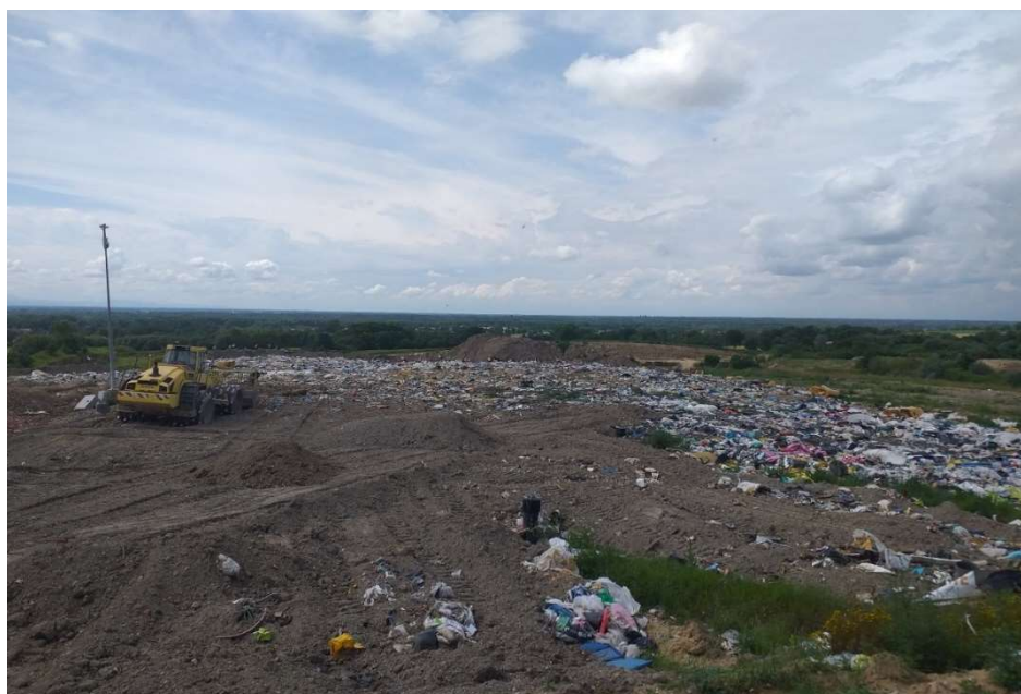
Vue des casiers W5 - W6

Ces deux casiers ont été réalisés dans le respect des dernières normes et obligations réglementaires en vigueur lors de leur construction. Ils sont équipés d'une géomembrane et ils disposent de drains en fond de casiers recouvert d'une couche de matériaux drainants. Chaque alvéole possède un puits situé en fond de casier afin de pomper les lixiviats.