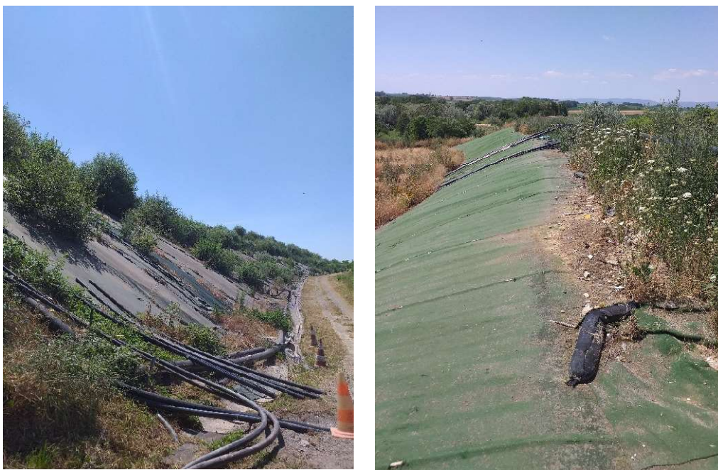
Wintzenbach 2 – couverture provisoire

Dans ce cadre et afin de prévenir une infiltration d'eaux météoriques à travers le massif de déchets, des dispositifs de couverture provisoires de type Covertop ® (240g/m 2 ) peuvent être mis en œuvre afin de limiter une surproduction de lixiviats.