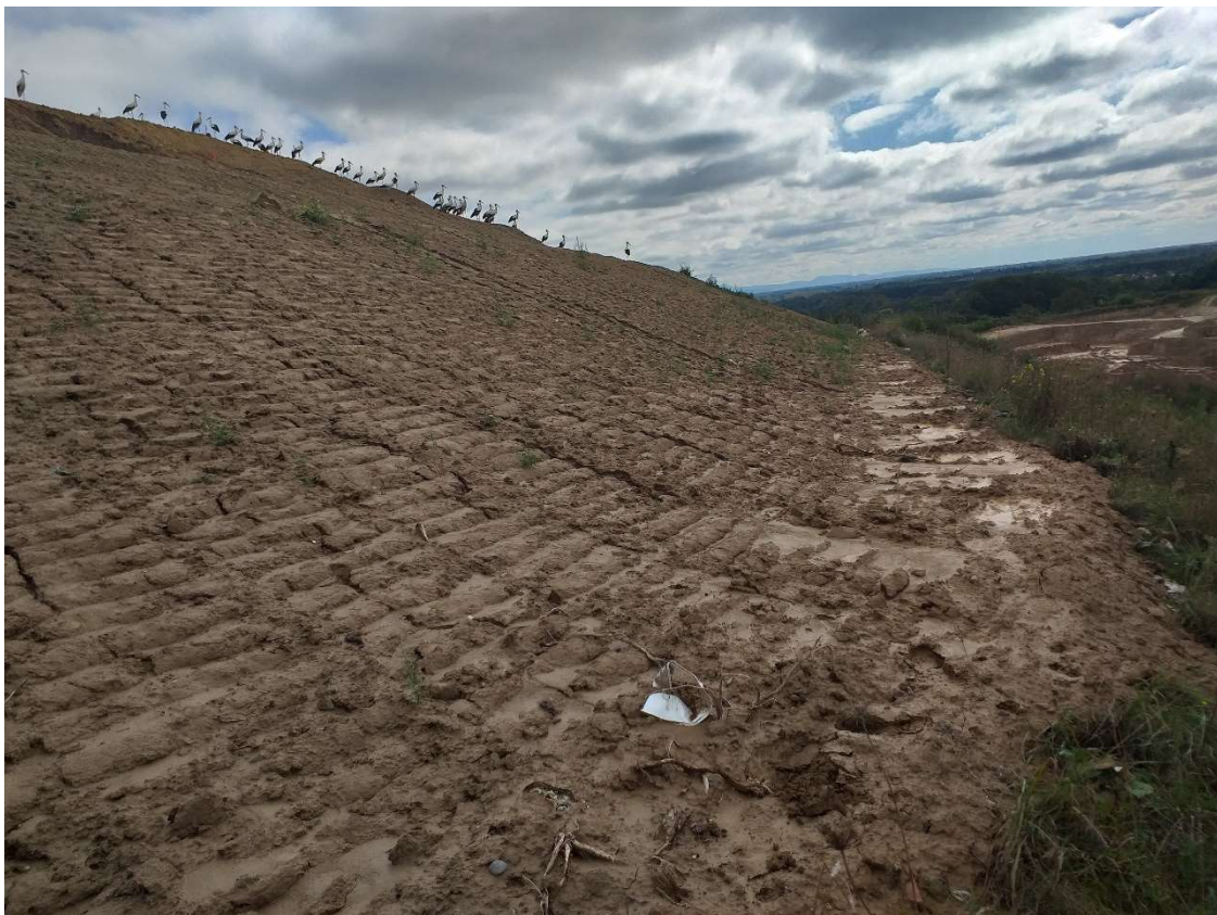
Digues de réhausse W5&6

Les casiers W5 et W6 se rapprochent de leur capacité maximale d'enfouissement. Les déchets se situent à la côte 179 NGF la côte maximale étant 189 NGF avec la couverture définitive.