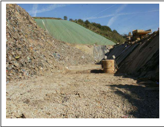
Evacuation des déchets le long de la plate-forme enrobée