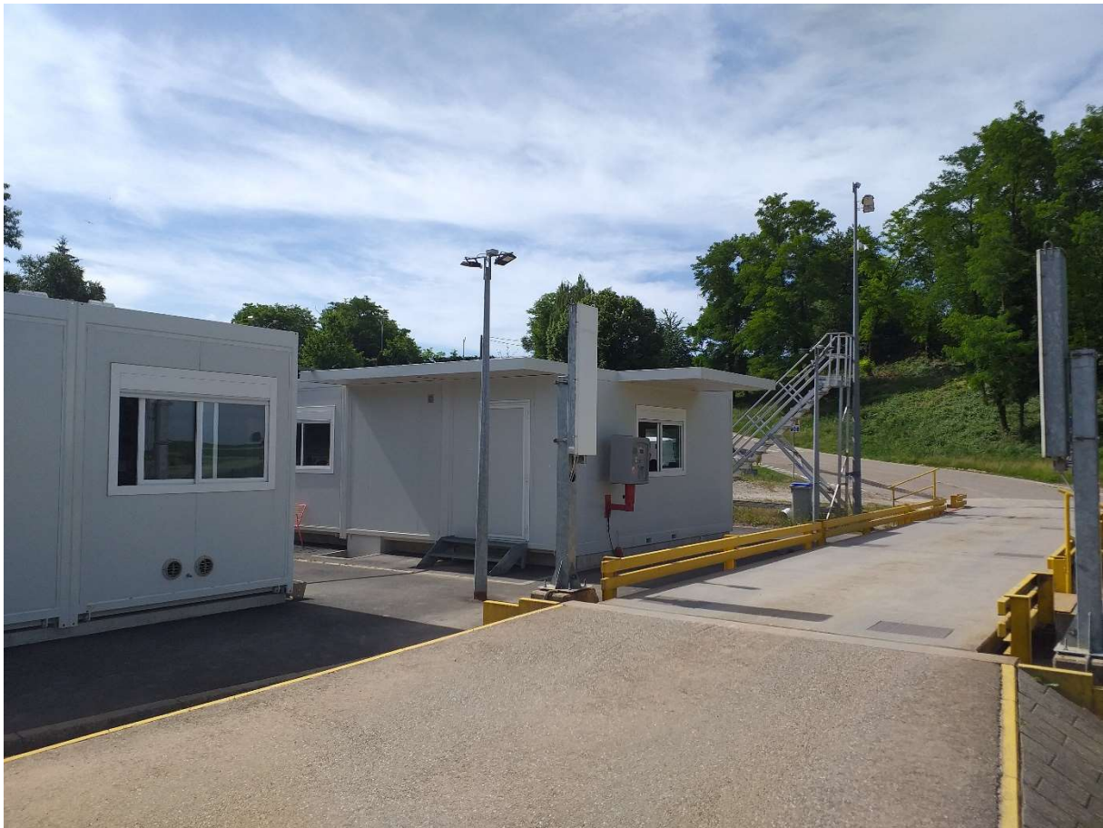
L'entrée du site et la borne de pesée.